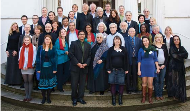
Voller Einsatz für eine gerechte und nachhaltige Zukunft: Über 60 Ratsmitglieder, Mitarbeiter und Berater nahmen an der vierten Jahreshauptversammlung des World Future Council teil.